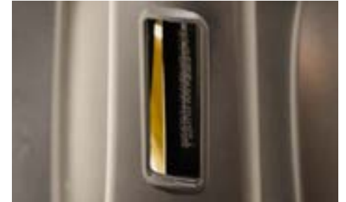
Chassinumret är stämplat på ramen framför föraren.

Vid en trafikkontroll kan du bli ombedd att uppge chassi och/eller motornummer.