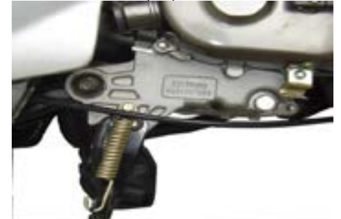
Motornumret är stansat på motorn vid variatoråpan.